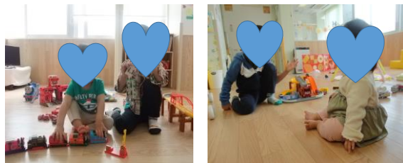
5月前半の利用の写真です。

医師から発行してもらった『医師連絡票』を添えて『利用申請書』を提出します。(記入間違いは、間違った箇所に二重線を引き、訂正印をお願いします。)