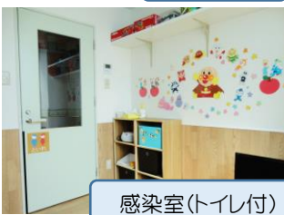
感染症室(トイレ付)