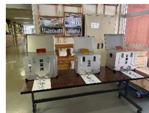
▲学校に設置された投票箱

今後は、3つの校名候補に対して市内の小中学生に1人1票で投票していただき、その結果を参考に統合準備委員会で最終候補案を決定していきます。