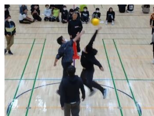
▲王様ドッジボール