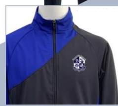
マーキングイメージ