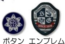
ボタン エンブレム