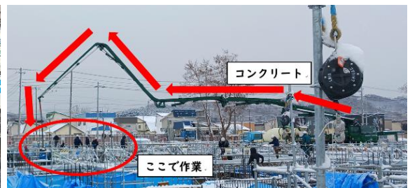
▲コンクリート作業