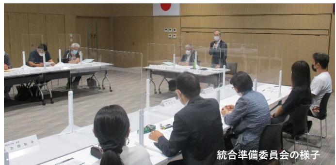
統合準備委員会の様子