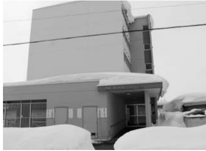
エレベーターの耐震改修工事を行う三砂ふれあい団地

さらに、団地環境整備事業として北光団地の公園改修整備を今年度より実施し、子育て環境、高齢者の健康づくりおよび多様な世代間交流の場の創出を図っていきます。