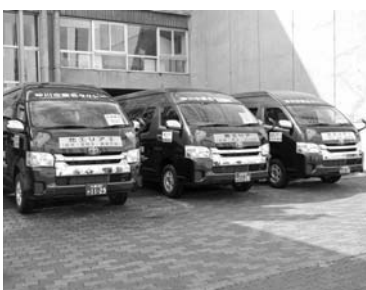
本格運行を開始した 予約型乗合タクシー