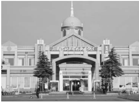
多くの観光客が訪れる 砂川ハイウェイオアシス館

砂川ハイウェイオアシス館内において、台湾や中国からの来訪者にも対応するため、中国語のパンフレットなどを設置して、まちなかへの誘導を促進するとともに、まちなか集客施設「SUBACO」において、商店の新たな情報発信やイベント等によりにぎわい創出と回遊を図り、まちなか活性化を推進していきます。