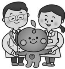
砂川みまもりんく SUNAGAWA MIMAMORILINK

住まい、医療、介護、予防、生活支援が一体的に提供される地域包括ケアシステムの構築に向けた取り組み、さらには、新規転入世帯に対して商品券を交付するハートフル住まいの推進事業の拡充による定住促進など、人口減少に歯止めをかけるための取り組みをより充実強化したところがあります。