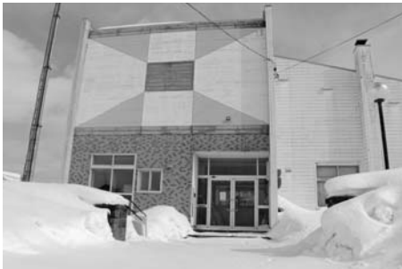
移転する南学童保育所

放課後児童の安心・安全な居場所づくりの場である学童保育については、中央学童保育所および南学童保育所において、施設の老朽化や遊び場所が狭いなどの問題が生じていたことから、今年度から小学校の余裕スペースを活用し、中央学童保育所を中央小学校へ、南学童保育所を砂川小学校および豊沼小学校へ移転し、より安全で利用しやすい環境づくりを進めていきます。