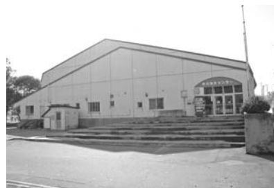
改修を行う海洋センター

海洋センターのアスベスト除去にあわせ、第1体育館照明のLED化および床の改修を行うとともに、老朽化している市営野球場の改修に向けた実施設計を行い、より快適な環境でスポーツに親しめるよう、改修を進めていきます。