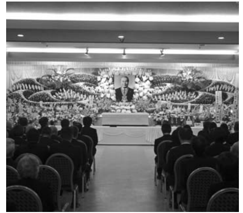
2月19日に行われた市葬の様子

その後、昭和46年4月北海道議会議員に当選し、通算4期16年間務められました。この間、北海道監査委員などの公職に就かれ、豊富な経験と卓抜な識見をもって公正な審査を行うとともに、本市においても北海道子ども国や北海道電力