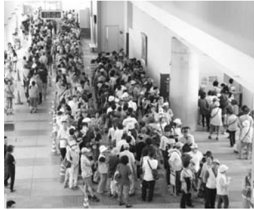
プレミアム商品券に 長蛇の列

商工会議所主催のプレミアム商品券発行事業および砂川商店会連合会主催の商品券発行事業にそれぞれ補助を行い、市内での消費喚起を促進するとともに、全国から約700名が集結する日本商工会議所青年部第29回北海道ブロック大会の砂川市開催に支援を行っていきます。