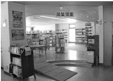
改修を行う 図書館児童閲覧室