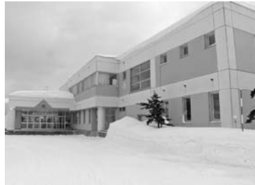
外壁の改修を行う 北光小学校

来館する乳幼児や児童、保護者が気がねすることなく利用できるよう児童閲覧室の改修等を行い、乳幼児や児童が読書に親しむことのできる環境づくりを創出していきます。