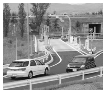
平成27年8月8日に開通した 砂川SAスマートインターチェンジ

高齢者・障がい者等が安全かつ快適に移動するために必要な砂川駅のバリアフリー化については、JR北海道と協議を進めるにあたり、設備改善調査を実施し、プラットホームの待合環境改善も含め、利便性の向上に向け検討していきます。