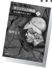
『ギリシア人の物語 1』 (塩野七生)

古代ギリシアに誕生した民主政の実像とは何か、なぜ機能したのか、少数兵力で巨大ペルシア帝国を破った民主主義の力とは…。ベストセラー『ローマ人の物語』へとつながる「それ以前の世界」の西洋文明の源流であるギリシア人の歴史を描く3部作の第1弾。