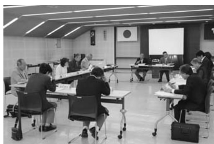
今後の庁舎のあり方を検討した 庁舎整備検討委員会

の基本的な考え方を整理したうえで、基本計画での具体的な検討につなげていくとともに、「庁舎建設審議会」を設置して、さまざまなご意見をいただきながら執行を進めていきたいと考えています。