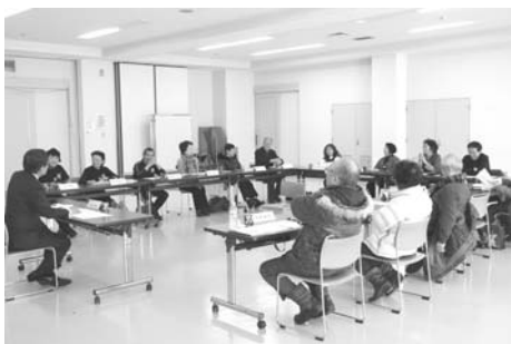
協働のまちづくり懇談会

また、地域コミュニティを活性化するためには、各町内会やボランティア団体、NPO法人等の市民活動団体の役割が非常に重要となってきたことから、町内会での地域活動が活発になるよう支援を行うとともに、市民活動団体の活動基盤が強化される側面的な支援等を行うことで、誰もがこのまちなかに「住みたい」「住み続けたい」「住んでよかった」と思える地域社会の構築を進めていきます。