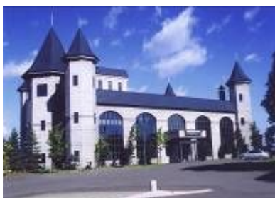
ウォーターヒルズスクエア

なお、ハートフル住まいる推進事業については、現在まちなか居住区域の83haを対象に優遇助成しているところであるが、今後、平成21年度に当該優遇助成区域を本基本計画における202haとして改定予定である。