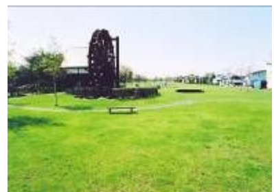
北海幹線用水路に蓋をして整備 した流れのプラザ