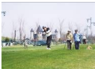
市民に開放されている パークゴルフ場