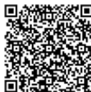
市議会インターネット中継 (ライブ配信) 二次元バーコード

http://www.city.sunagawa.hokkaido.jp/shisei/shigikai